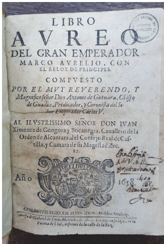
Imagen 2. Portada tipográfica del ejemplar