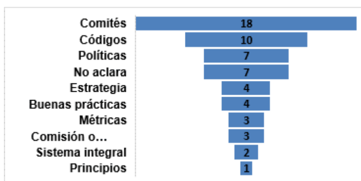
Figura 3. Gestión de riesgos ambientales, sociales y de gobierno corporativo en CGS en términos absolutos y relativos

Considerando aquellas que tienen CGS publicado, la forma en la que se refieren a la “gestión de riesgos ambientales, sociales y de gobierno corporativo” es heterogénea. En la Figura 3 se ve que la forma más común es la conformación de un Comité que, por lo general, es de Transparencia o de Ética y, en otros casos, más específico como Sustentabilidad o Género. Estos Comités responden a actividades delegadas por el directorio y a quien luego le hacen entrega de distintos informes para demostrar el grado de avance de las problemáticas que tienen a cargo y sus posibles vías de acción. Para hacer frente a la gestión de riesgos ASG en segundo lugar, aparecen los códigos que se dividen en Códigos de Ética y Códigos de Conducta los cuales en algunas entidades aparecen ambos. Luego, se muestran diferentes formas de incorporar la temática a la gestión empresarial, como las políticas, la estrategia, las buenas prácticas y las métricas. Es dable destacar que en 7 entidades no se hace referencia a este tema en los CGS lo que muestra una falta de información significativa para los requerimientos mencionados al comienzo del trabajo.