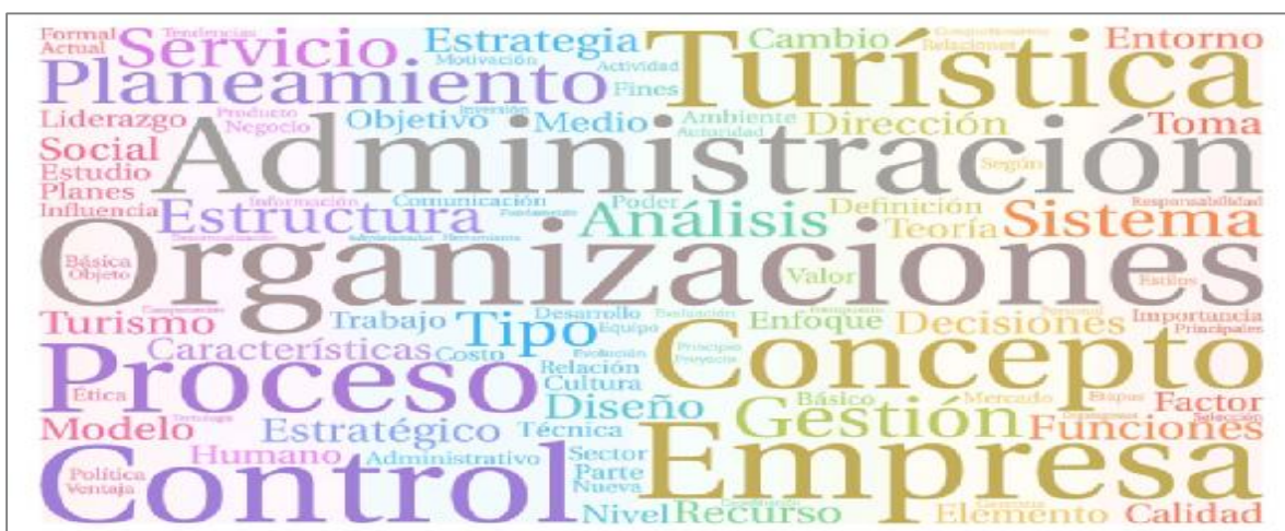
Figura 3. Palabras frecuentes en los programas de Administración General.

Para comenzar el análisis del contenido de los temas incluidos en las materias vinculadas a la Administración General, se recurre a la creación de una nube de palabras, por ser una herramienta gráfica que facilita la visualización de los resultados. En la figura 4 se presenta una nube con las 100 palabras más frecuentes en los programas o contenidos mínimos de estas materias.