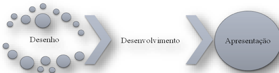
Figura 2: Fases de desenvolvimento da tese