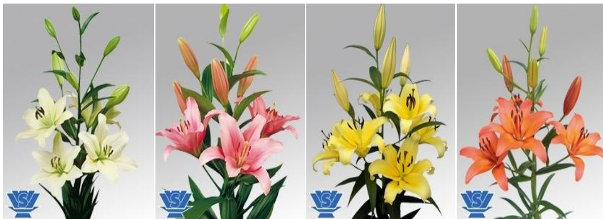
Figura 2. Vara floral de: A) Lilium LA “Litouwen”, B) Lilium LA “Brindisi”. C) Lilium OT “Serano”, y C) Lilium Asiático “Nello”.

El emprendimiento producirá bulbos de 4 híbridos de lilium : 2 L/A (“Litouwen” con flores de coloración blanca y “Brindisi” de coloración rosada); 1 O/T (“Serrano” de coloración amarilla); y 1 Asiático (“Nelo” de flores color naranja) (Figura 2). Se busca brindar una oferta variada en cantidad de colores y comportamiento, considerando la demanda de flores de lilium a atender.