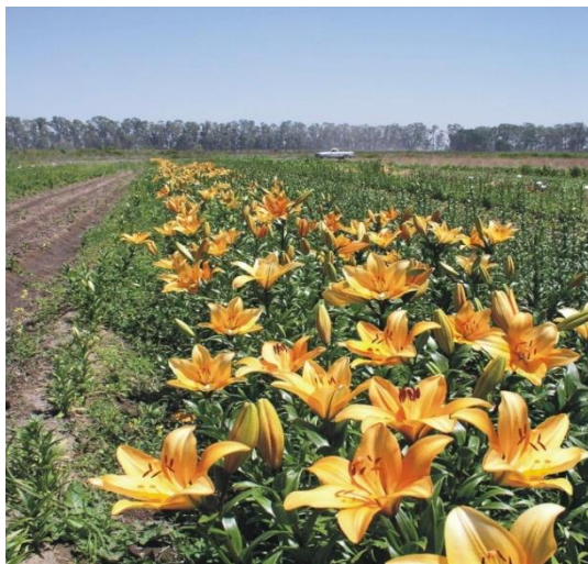
Figura 1. Vista de una plantación de lilium a campo para producción de bulbos

El género Lilium pertenece a la familia de las Liláceas, reúne a la mayoría de las plantas conocidas como azucenas o lilium , estando extensamente distribuido por todo el Hemisferio Norte lo que conlleva cierta controversia en cuanto a su clasificación botánica (Figura 1).