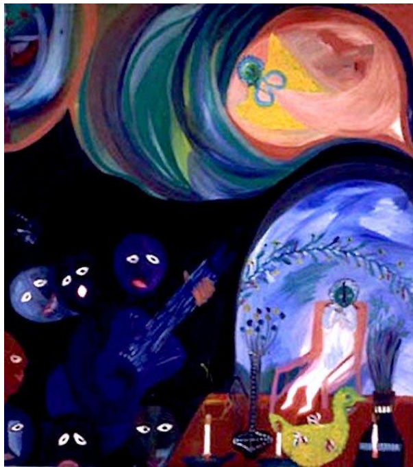
Imagen Nº 2: "La muerte del angelito", pintura de Violeta Parra.

porque también en el cielo / los hemos de ver los dos. / Y en este trance veloz / yo voy a cumplir mi destino / purificado y divino / y en la gloria entraré. / Y antes de irme diré / y adiós, adiós mundo indino. / Virgen de nos y parientes / yo a todos le digo adiós / ya mi plazo se cumplió / y conmigo la muerte. / Dichosas fueron mis suertes / mayor fue algún pesar, / yo me juro confesarme / ya voy, ya voy padre eterno, / ya me olvide del infierno / que sabe todos los males. / ya me olvide del infierno / que sabe todos los males".