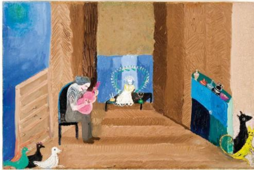
Imagen Nº 1: "Velorio de angelito"- Bordado de Violeta Parra.