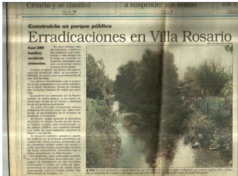
Titular diario La Nueva Provincia 11-14-99