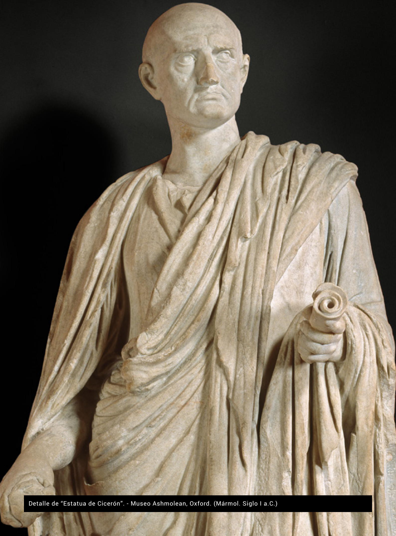
Detalle de "Estatua de Cicerón". - Museo Ashmolean, Oxford. (Mármol. Siglo I a.C.)