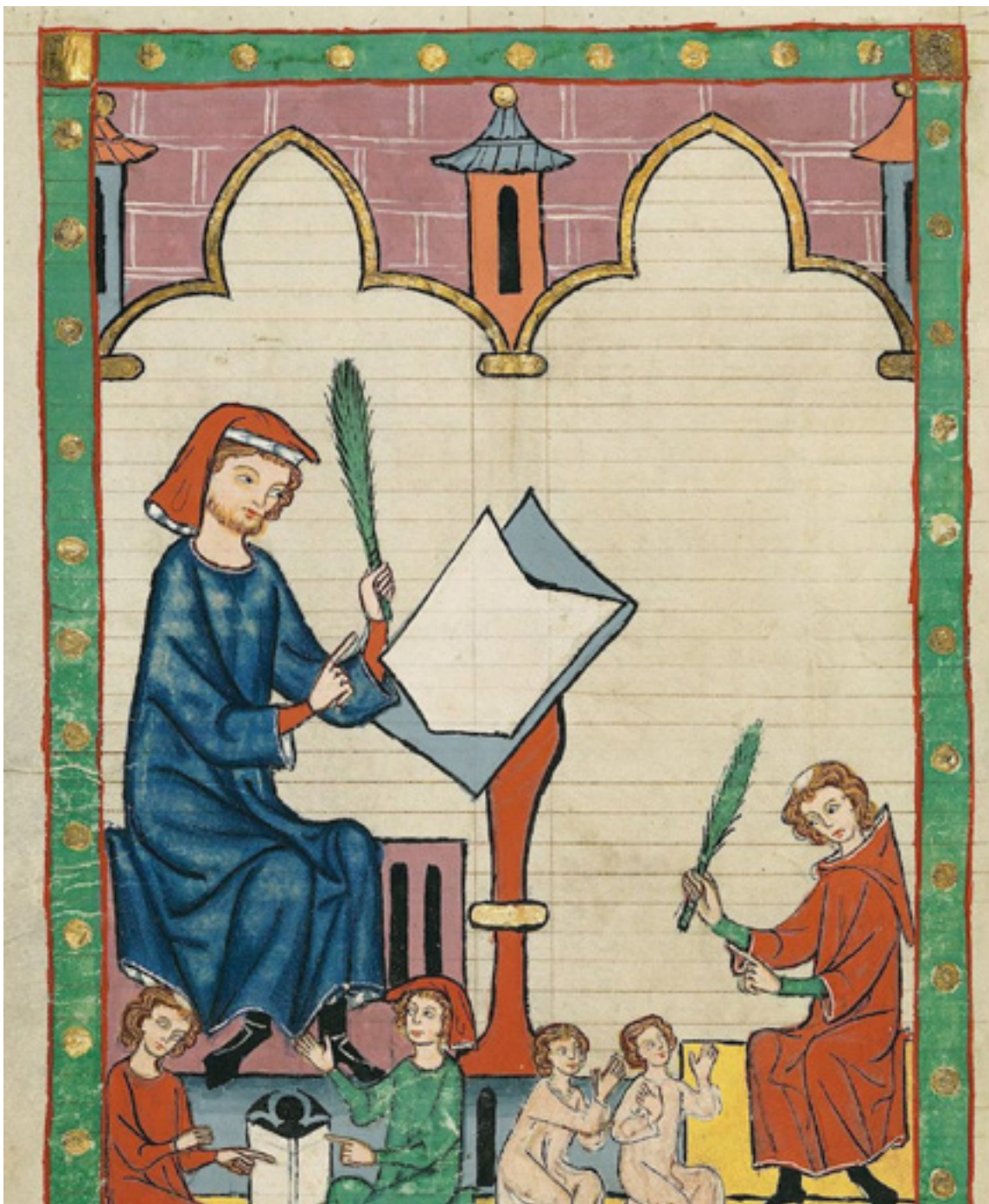
Ilustración del Códice Manesse (Heidelberg, Biblioteca de la Universidad - ca. 1305 - 1340)

tiene como la finalidad dar respuesta a interrogantes tales como: ¿Qué escuchaban los hombres y las mujeres del Medioevo? ¿Cómo lo hacían? ¿Qué lugar le otorgaban a los sonidos y los silencios? ¿Qué importancia tenían los testigos o los testimonios auriculares? ¿Qué registros tenemos de los diferentes sonidos medievales? Estos interrogantes constituyen sólo una muestra de las múltiples preguntas que pueden realizarse los historiadores, ante “las cuestiones sonoras y auditivas”, a nuestro entender, una problemática que incita a seguir pensando a los hombres en el tiempo. —